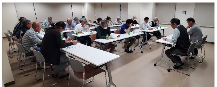
総会資料を精査して頂きました

総会に先立ち、5月15日(金)コミュニティ運営委員会を実施しました。運営委員の皆様、お忙しい中ありがとうございました。