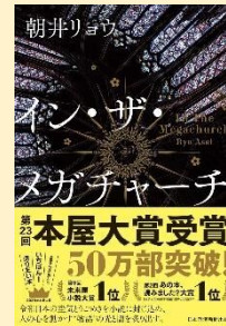
イン・ザ・ メガチャーチ 朝井リョウ