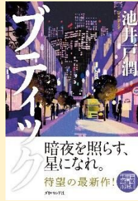
ブティック 池井戸 潤