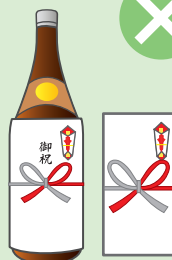
お祭りへの寄附・差し入れ、町内会の集会・旅行などの催物への寸志・飲食物の差し入れ