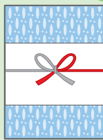
お歳暮・お年賀など