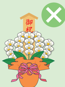
落成式・開店祝などの祝花、葬儀の供花、病見舞いなど