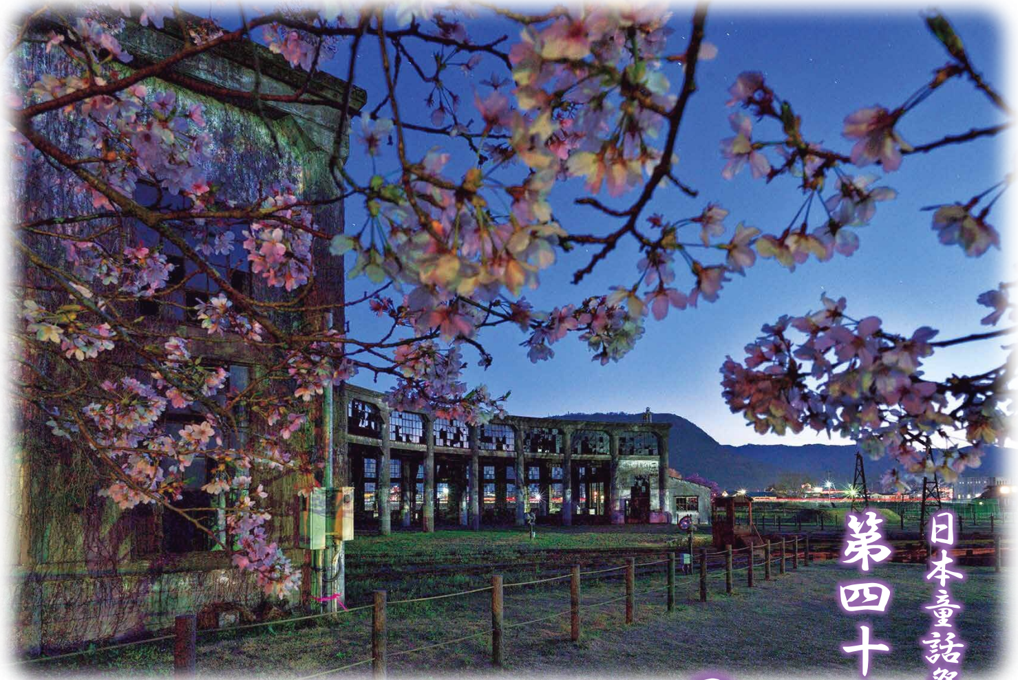
あさや きゅうぶん ごもり きかんこ 朝焼けの旧豊後森機関庫