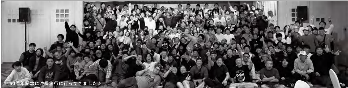
50周年記念に沖繩旅行に行ってきました。

URL : https://kusumachi.jp Email : info@kusumachi.jp