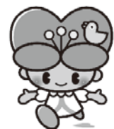
大分県人権啓発イメージキャラクター こころちゃん

相談内容は固く守られていますのでご安心ください。なお、相談は電話でも受け付けていますが、相談内容によっては、ご来館が必要な場合があります。