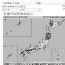
気象庁ホームページ