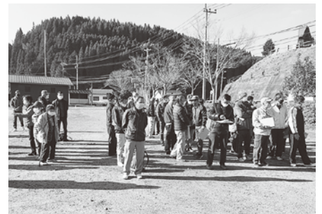
自治区ごとに集まって避難者の確認

皆さんも、家庭にあるハザードマップの再点検、近くにいる要支援者の把握、避難する際の経路・準備物など、家庭や地域の現状を再確認してください。