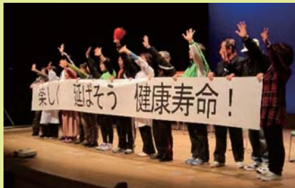
玖珠地区愛育健康づくり推進協議会の「創作健康劇」健康づくりの課題やヒントを、独特の熱のこもった迫真の演技で表現しました！