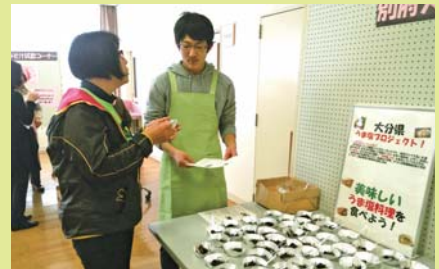
減塩お味噌汁や、野菜たっぷりメニューの試食（別府大学・玖珠町食生活改善推進協議会）