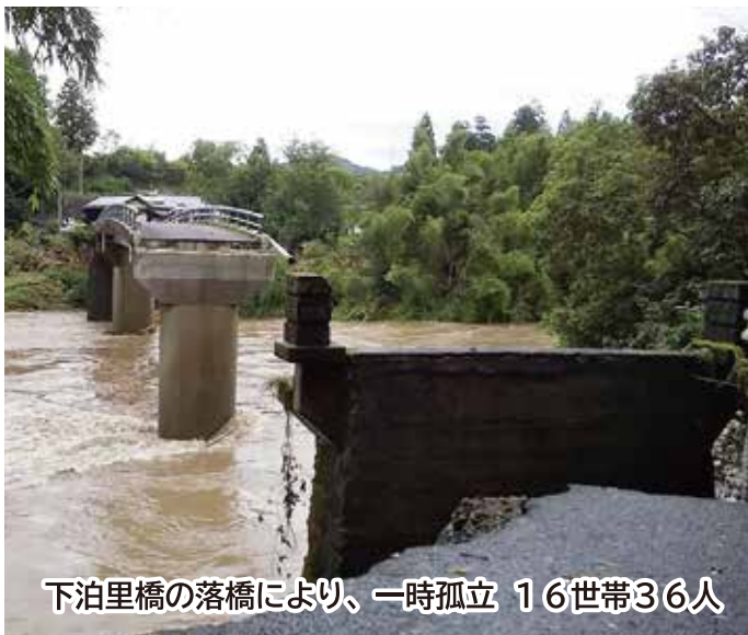
下泊里橋の落橋により、一時孤立 16世帯36人