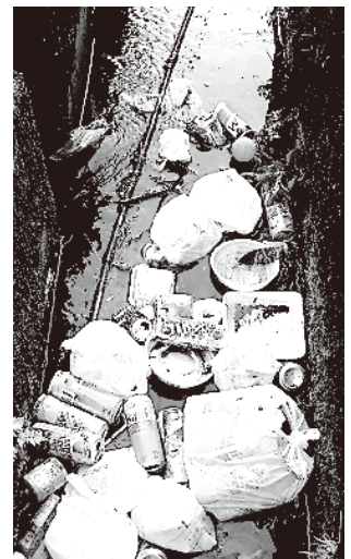
↑ 水路に投棄された家庭ごみ