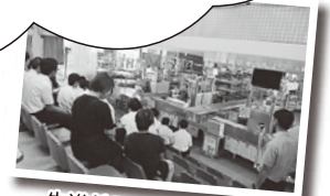
先進地研修（花市場）