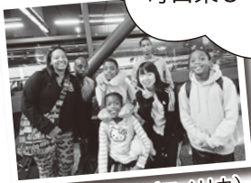
海外派遣研修（アメリカ）

月1回の美山マルシェでは、自分たちの作った野菜や草花、ジャムやハムなどを販売します。地域の人に喜んでもらえてうれしいです。