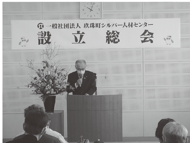
3月23日に行われた法人設立総会の様子

これまでの事業の公益的・公共的性格を名実共に明確化し、法的安定を確保するため、令和2年度から一般社団法人として再スタートを切りました。