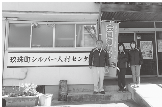
玖珠町シルバー人材センター職員一同

高齢者が働くことを通じて生きがいを得るとともに、地域社会の活性化に貢献する組織です。