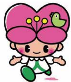
大分県人権啓発イメージキャラクター「こころちゃん」