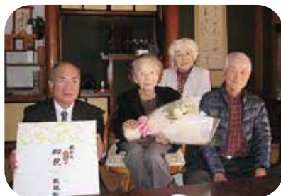
英カ子コさん （大正8年11月30日生）