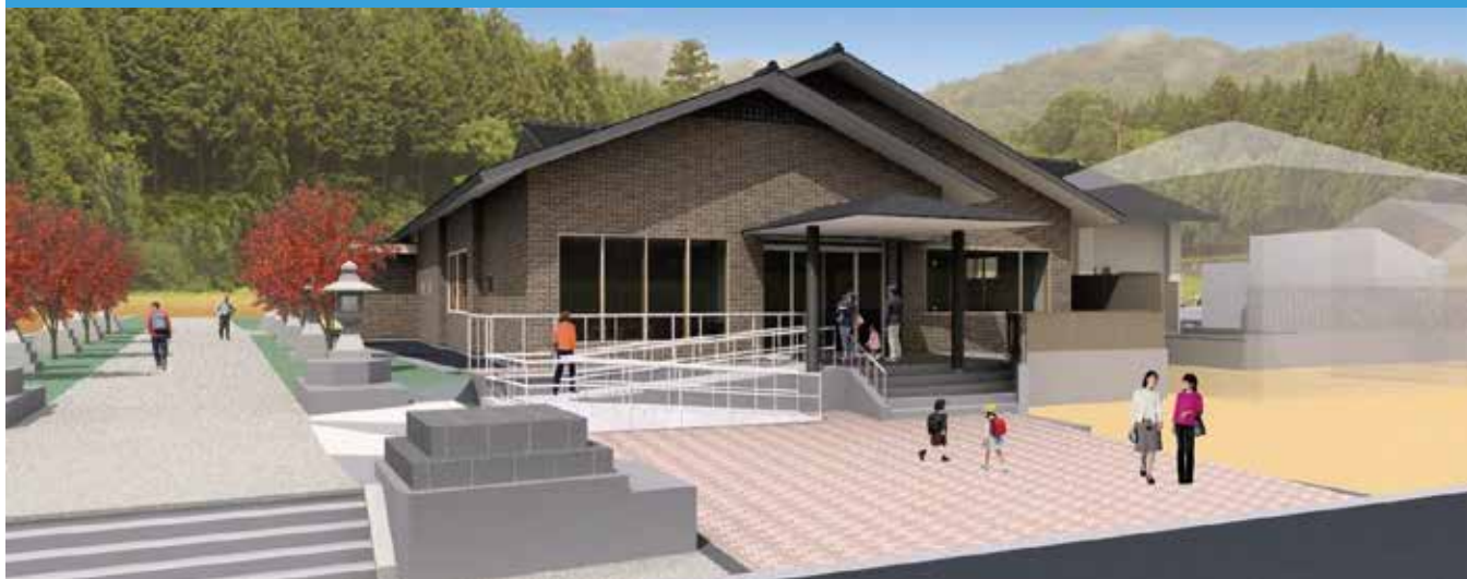
町道平川線側からの完成予定パース

現在の北山田自治会館の老朽化に伴い、自治会館の建て替えを行います。 今回は基本的な設計と完成予想図を紹介します。なお、計画変更により、建屋は平屋建てとなりました。 今後、現自治会館の解体及び建築工事を行い、新自治会館は令和4年3月完成を予定しています。 工事の期間中、利用者の皆様には、ご迷惑をおかけしますが、ご協力をお願いします。