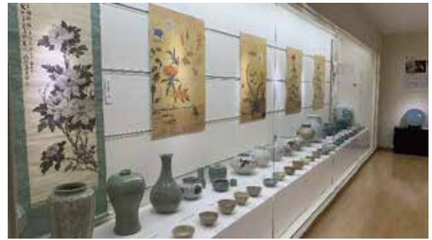
韓国を代表する現代陶芸家の作品を100点展示中

【🐾12月の足あと🐾】森中央小学校2年生の皆さん 12月5日(木)に来館されました。