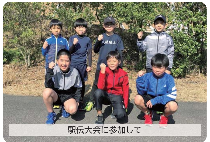
駅伝大会に参加して

主な大会：大分県小学生陸上競技大会、日田市陸上記録会、玖珠郡陸上記録会 大分県スポーツ少年団駅伝大会、玖珠郡スポーツ少年団駅伝大会