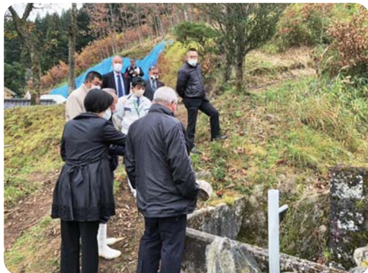
田の平～山角線現地調査

本陳情は、豪雨時に上勢地区の裏山からの水が、現在の水路では溢れるため町道に排水溝を設置してもらいたいと要望するものです。