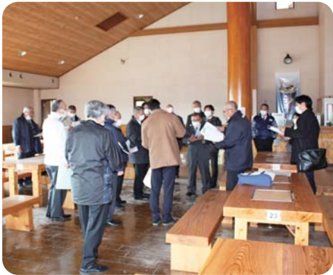
カウベルランドくす土地購入事業

カウベルランドくすの土地を、町が購入するために、必要な予算5924万2420円が、本定例会に上程されました。 現地調査を行い、執行部からの説明を受け、質疑応答を行い議場において、全会一致で可決しました。