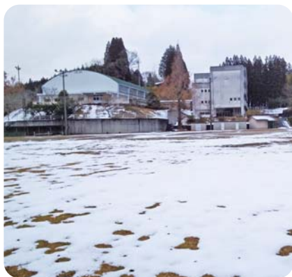
旧北山田中学校グラウンド