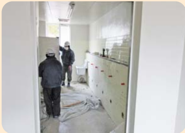
トイレ等改修工事