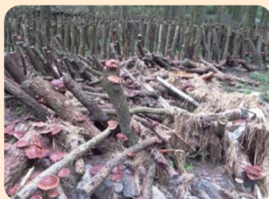
椎茸栽培施設等復旧