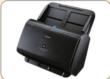
スキャニングインフラ整備