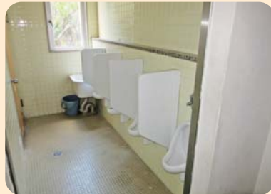
トイレ等改修工事