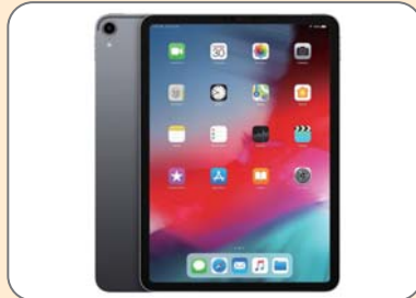
タブレット機器導入