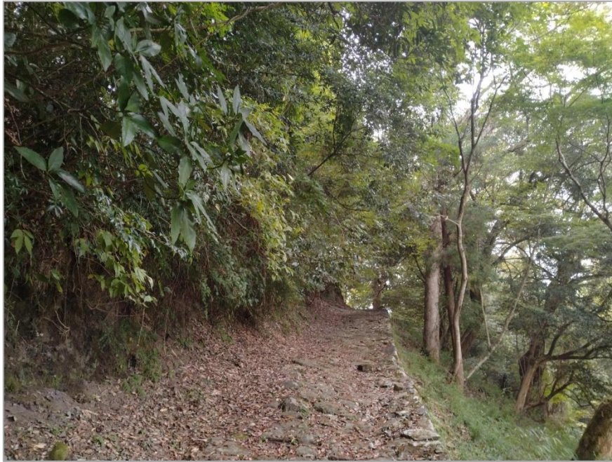
丸木御門参道（伐採前・御門側より）

事業を行った森林は名勝指定地内であるため、庭園を毀損しないよう特殊な伐採方法で実施しました。庭園内には、ほかにも未整備の森林があります。神社や庭園の景観回復を図るため、今後も継続した植栽整理が必要になります。