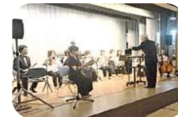
大分ウィンドフィルハーモニー