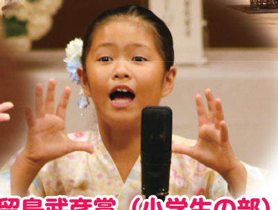
久留島武彦賞 (小学生の部) 「吉四六話 火事騒動」