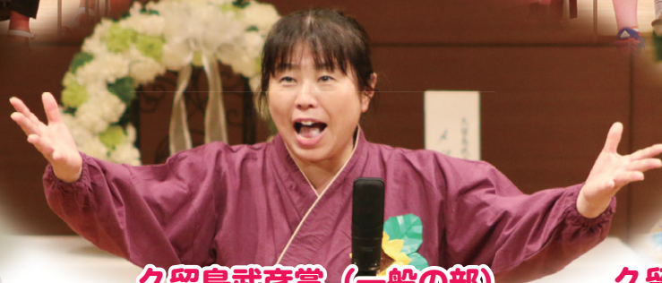
久留島武彦賞 (一般の部) 「へっこきよめさま」