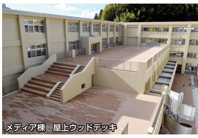
メディア棟 屋上ウッドデッキ