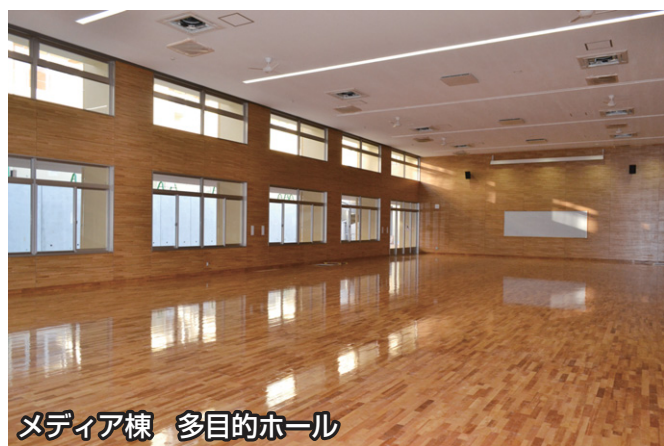
メディア棟 多目的ホール