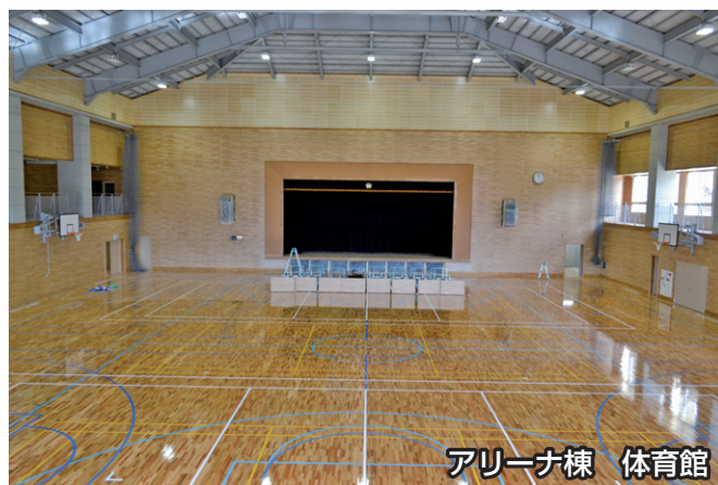
アリーナ棟 体育館