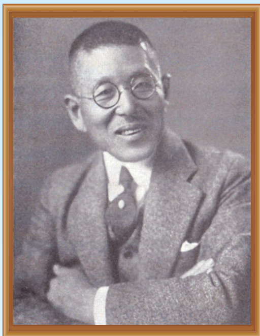
日本のアンデルセンと称えられた 口演童話家 久留島武彦

お話を語って歩くことに生涯をついやした 久留島武彦生誕の地“くすまち”で、童話・民話 (創作も可) の一人語りを行う出場者を募集します。