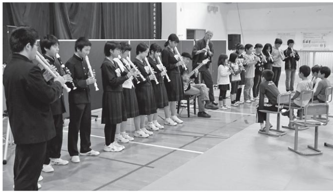
古後中学校で。児童生徒と合奏。

また、26日午前には塚脇小学校で開催されたコンサートでは、終盤には児童がリズムに乗って演奏者の二人と楽しい時間をつくりあげていました。