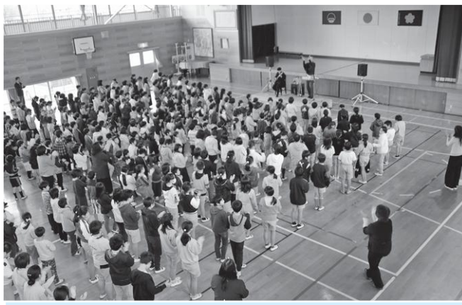
塚脇小学校で。みんなでリズムを刻みます。