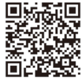
キャンペーンサイト