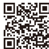
事業所専用フォーム