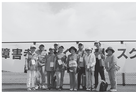
フライングディスクの参加者の皆さん

選手団は、玖珠町身体障害者協議会の方々を中心に、町内の障害福祉事業所を利用する方も加わり13名で編成。卓球や陸上競技、フライングディスクにエントリーし、日ごろの成果を存分に発揮しました。