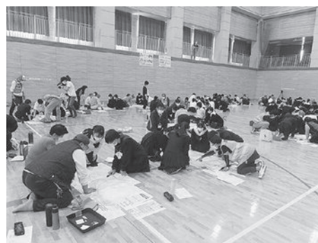
ハザードマップを確認する生徒と地域住民

事前に自宅からの避難ルートを確認しておくことは、災害時において安全に避難するための非常に有効な手段です。ご家庭にある防災マップを活用しながら、災害への備えを行ってください。