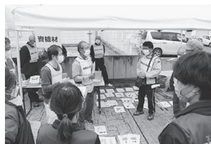
B & G海洋センターで行われた訓練の状況