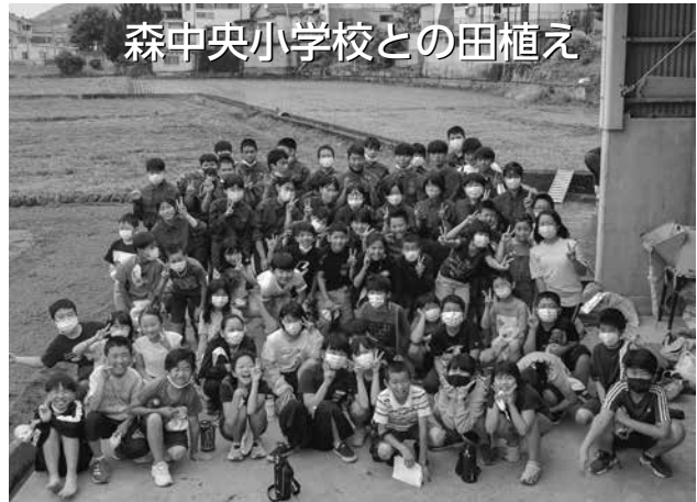
森中央小学校との田植え

進路に応じて、分かりやすく、力のつく授業を受けることができます。少人数や個別指導で丁寧に対応してくれるので、安心して勉強に取り組めます。