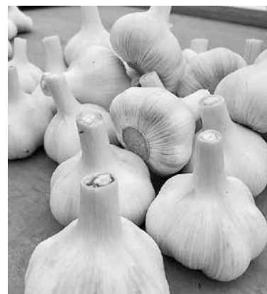
収穫したニンニク