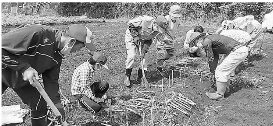
ニンニク収穫作業の様子

参加者は、おみやげにももらったニンニクとジャガイモで、今晚のおかずは何にしようかと、笑顔を見せ、大人も子どもも楽しく体験ができました。