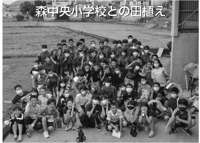
森中央小学校との田植え

進路に応じて、分かりやすく、力のつく授業を受けることができます。少人数や個別指導で丁寧に対応してくれるので、安心して勉強に取り組めます。