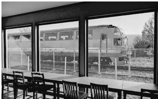
玖珠・森のクレヨン店内