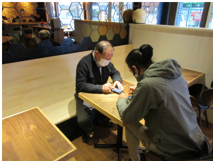
(上段) 泊里公民館でのスマホ講座 (下段) 困りごと相談中