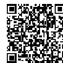
チャットボット (ふたば)