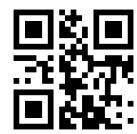
あずかるこちゃん